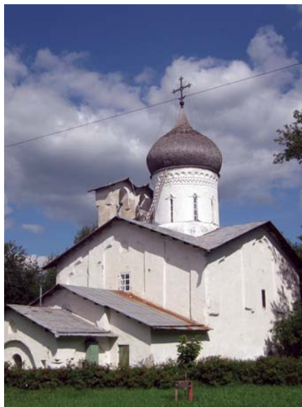
Церковь Николая со Усохи