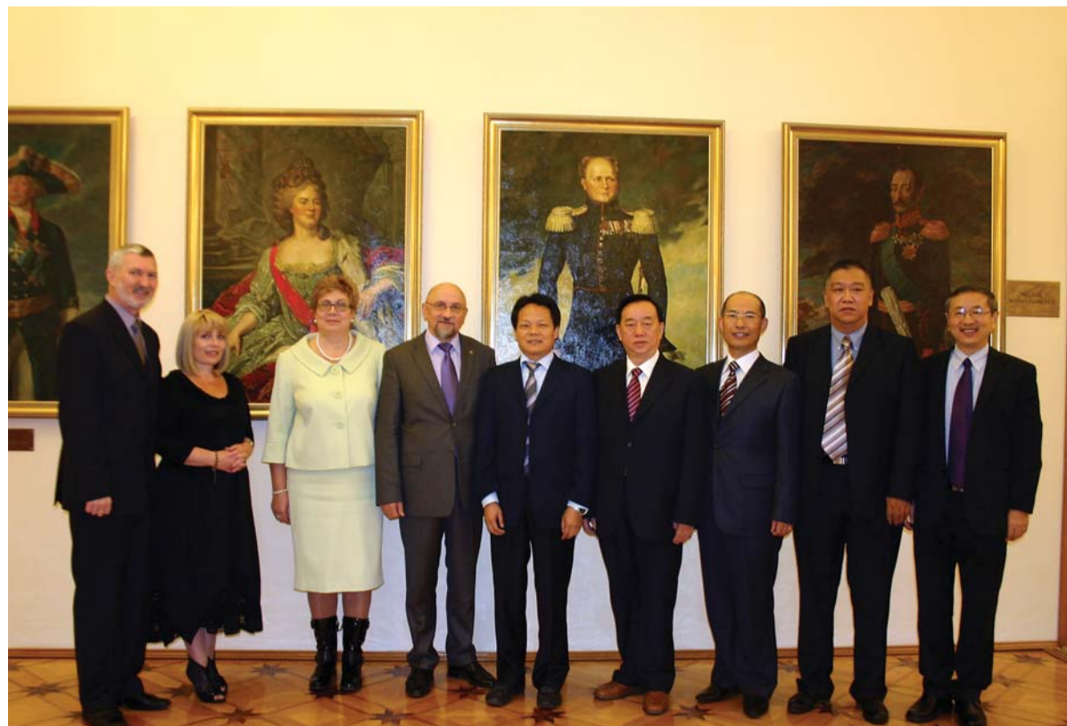
Фото на память в исторических интерьерах РГПУ им. А.И. Герцена.

В результате стороны подписали протокол о намерениях в целях развития совместных проектов в области образования и подготовки специалистов.