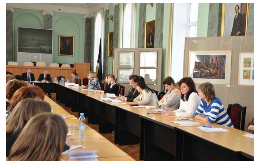
Дискуссионная площадка «Какое образование становится фактором конкурентных преимуществ»