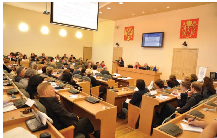
Круглый стол «Социальная роль и компетентности современного учителя: ответственность, ожидание и реальность».

«На II Всероссийской педагогической ассамблее действительно очень широко представлено педагогическое сообщество России. В работе дискуссионных площадок ассамблеи принимали участие не только преподаватели высших учебных