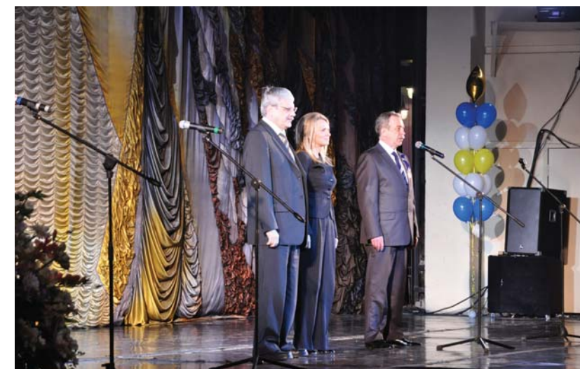
Заместитель председателя Законодательного Собрания Санкт-Петербурга П.М. Солтан, председатель Комитета по образованию Санкт-Петербурга Н.В. Третьяк и ректор Герценовского университета В.П. Соломин