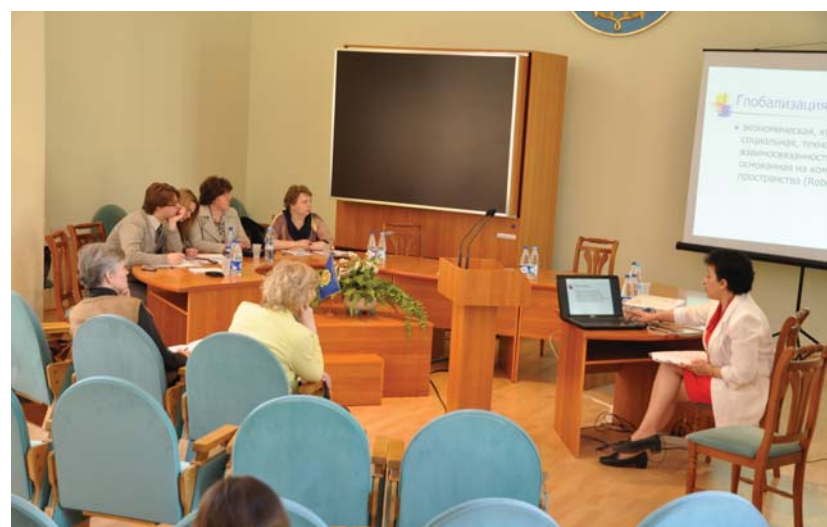
Дискуссионная площадка «Самореализация студента в условиях множественных контекстов образования»