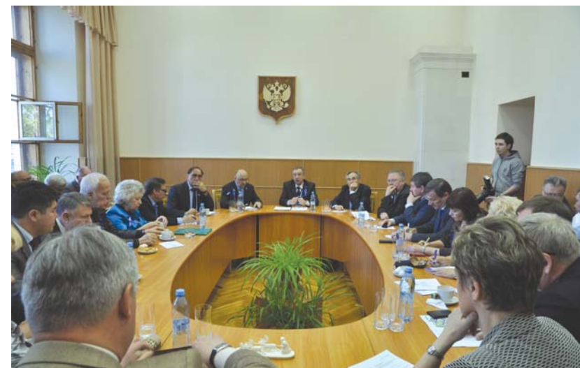
Заседание ректоров вузов-участников сетевого объединения