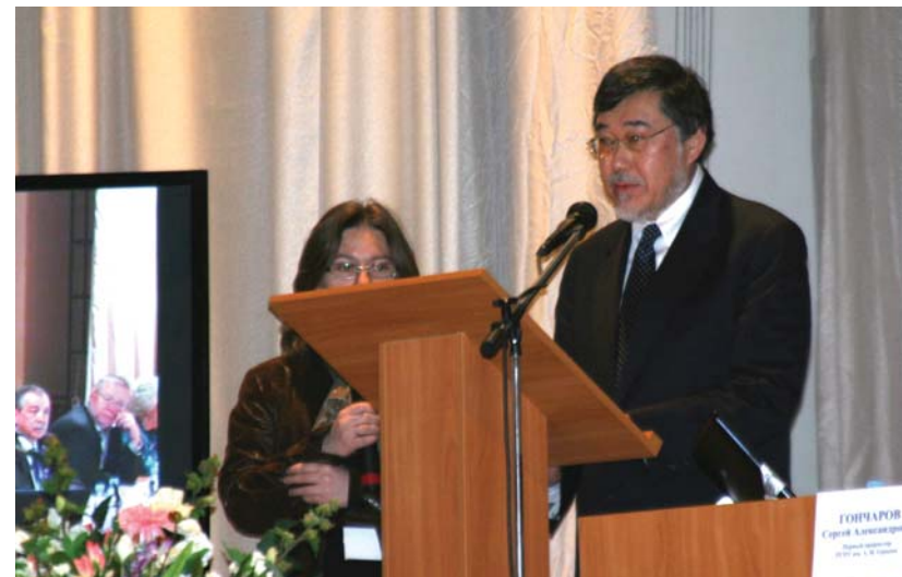
Выступление президента Международной ассоциации школ права (IALS) на заключительном пленарном заседании