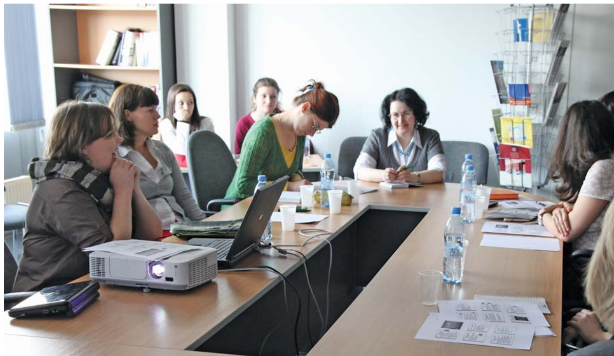
Участники семинара «Рабочая тетрадь учителя финского языка»