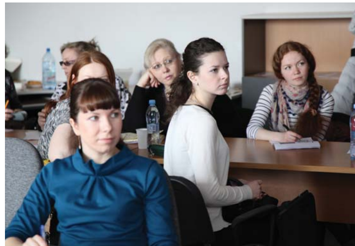
Участники семинара «Рабочая тетрадь учителя финского языка»