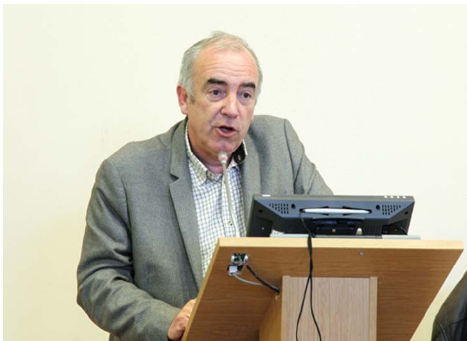
Алан Баратон читает лекцию в Герценовском университете